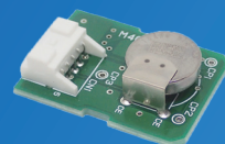
CMM5141 近日発売 低濃度 CO 用ガスセンサ